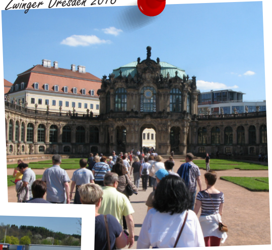
Zwinger Dresden 2016