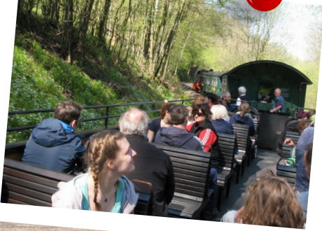
Dampfzugfahrt im Erzgebirge